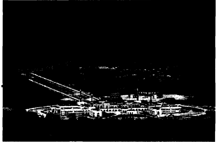
...ความสวยงามของทรัพยากรธรรมชาติบนเกาะนาตุนา...

นอกจากอินโดนีเซียจะได้ชื่อว่าเป็นประเทศที่มีเศรษฐกิจขนาดใหญ่ที่สุดในเอเชียตะวันออกเฉียงใต้แล้วยังเป็นประเทศที่ปกครองภายใต้ระบอบประชาธิปไตยที่ใหญ่เป็นอันดับ ๓ ของโลก และมีความสัมพันธ์ที่ค่อนข้างสมดุลทั้งกับสหรัฐฯ และจีน นอกจากนี้ อินโดนีเซียยังมีผลประโยชน์โดยตรงในการใกล้ชิดข้อพิพาทในทะเลจีนใต้ แต่เมื่ออินโดนีเซียประกาศว่ามีความขัดแย้งทางทะเลกับจีน ทำให้เป็นโอกาสที่เหมาะสมและสำคัญที่ไทยจะแสดงบทบาทผู้นำของอาเซียนในการใช้มาตรการทางการทูต